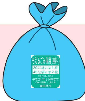
ブルーの半透明(30ℓのごみ袋)